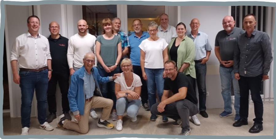
12.09.23 Region Buchholz