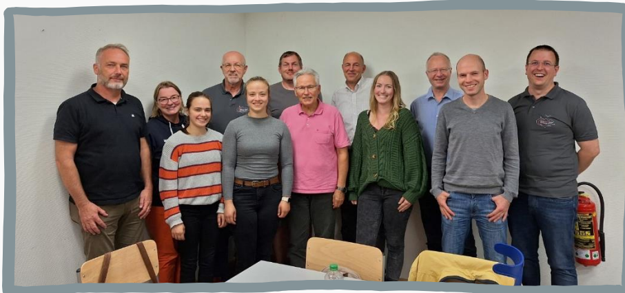
13.09.23 Region Seevetal