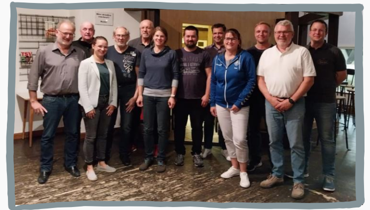
21.09.23 Region Tostedt